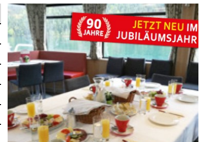
Sonntagsbrunch jeden 1. Sonntag im Monat — Reservierung erforderlich!

M0 * ...für Gruppen ab ca. 30 Personen nach tel. Voranmeldung