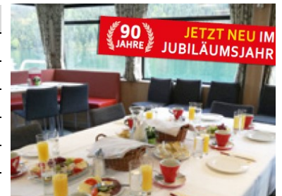
Sonntagsbrunch jeden 1. Sonntag im Monat — Reservierung erforderlich!

M0 * ...für Gruppen ab ca. 30 Personen nach tel. Voranmeldung M1/M2...MS Alpenperle (bei bestellter Charterfahrt übernimmt MS Austria) Es steht für Gruppen auch ein eigenes Charterschiff zur Verfügung - Anfragen unter 04761 / 242 oder 0660 / 65 80 667